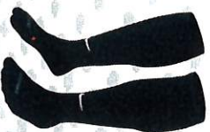
CHAUSSETTES ARBITRE HOMME M L XL TARIF 6€ 38/42 42/46 46/50