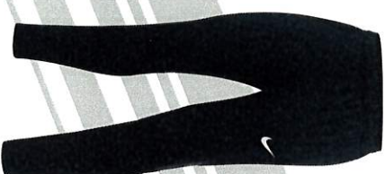
PANTALON ACA PRO HOMME S M L XL 2XL TARIF 30€