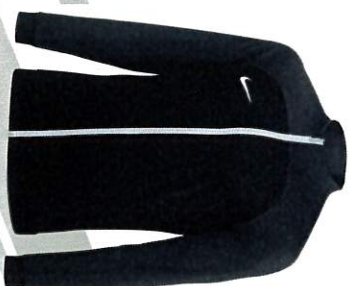
VESTECACA PRO HOMME S M L XL 2XL TARIF 32€