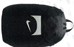
SAC A DOS ACCESS TU TARIF 26€