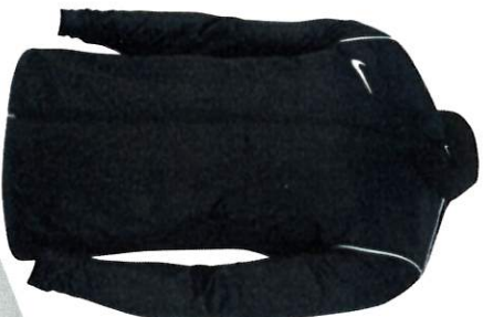
COUPEVENT PARK 20 HOMME S M L XL 2XL TARIF 24€