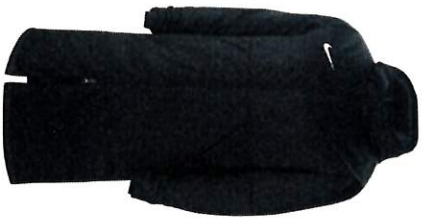
PARKA WINTER JACKET HOMME S M L XL 2XL TARIF 78€