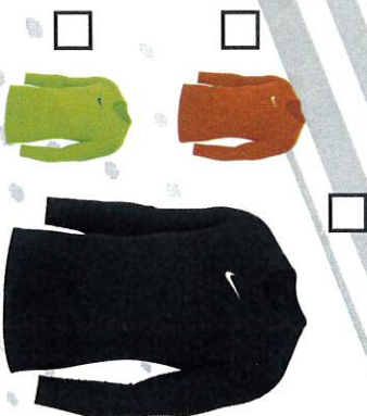
SOUS MAILLOT NOIR HOMME S M L XL 2XL TARIF 17€