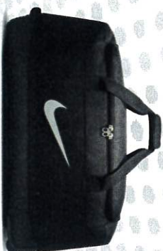
SAC A ROULETTES 120L ACCESS TU TARIF 35€