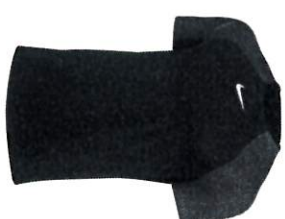
MAILLOT ACA PRO HOMME S M L XL 2XL TARIF 19€