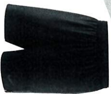
SHORT ARBITRE HOMME S M L XL 2XL TARIF 24€