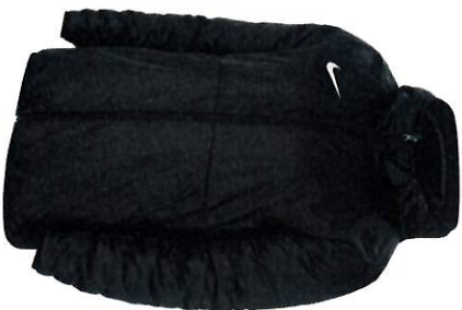
VESTE HIVER DUFFEL HOMME S M L XL 2XL TARIF 60€